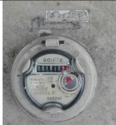
Foto No. 4. Medidor del pozo pz-09-0040 arrojando valor de volumen acumulado de 1810.22 m 3 .