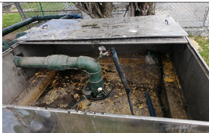
Fotografía 2. Cabeza de la captación