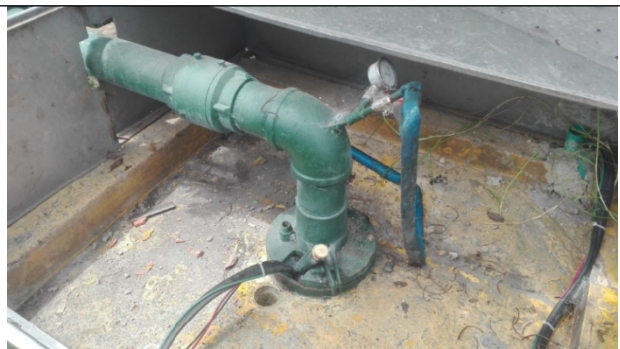
Foto No. 2 Boca del pozo pz-09-0040