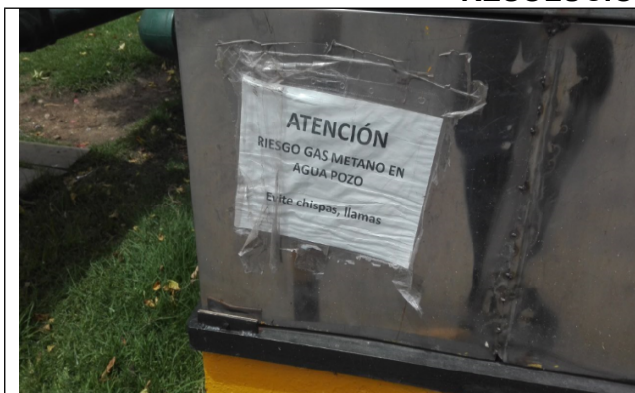
Foto No. 5 Aviso de advertencia de existencia de gas metano en el pozo