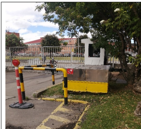
Fotografía 1. Estructura metálica que recubre al pozo pz-09-0040.