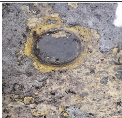
Fotografía 3. Placa de nivelación y georeferenciación.