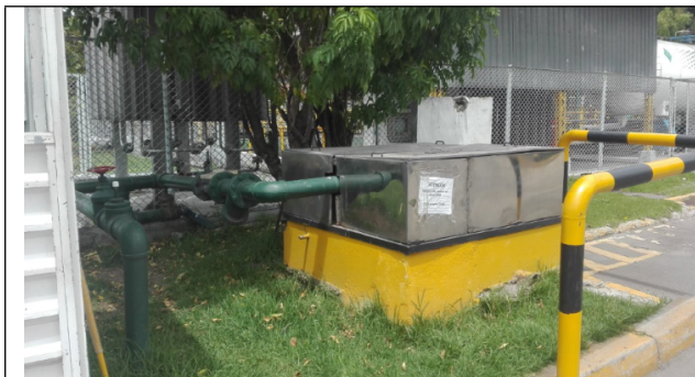
Foto No. 1 Vista general del pozo pz-09-0040.

Las condiciones físicas se encontraron en buen estado, el usuario instaló un aviso mediante el cual advierte que la captación libera gas metano, la placa de identificación y nivelación se observó en mal estado, y se verificó el dato del volumen acumulado del medidor con un valor de 1810.22 m 3 ..