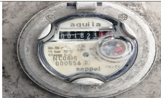
Fotografía 4. Medidor con volumen acumulado de 1823.11 m 3 .