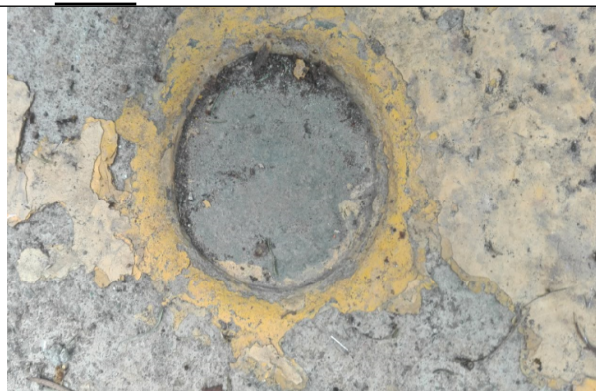
Foto No. 6. Placa de identificación del pozo la cual no es legible.

Al realizar una comparación con el registro fotográfico del Concepto técnico 3524 del 11/04/2015, se observa que existe una diferencia en el dato del volumen acumulado del medidor, ya que el concepto técnico mencionado reportó un valor de 101.60 m 3 , medidos el día 05/06/2014; comparando con el dato de medidor reportando en el presente informe, se observa una diferencia de 708.62 m 3 , lo cual es indicador de un consumo ilegal del recurso hídrico.