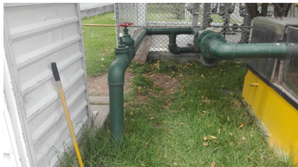
Foto No. 3 Estructura hidráulica externa del pozo pz-09-0040